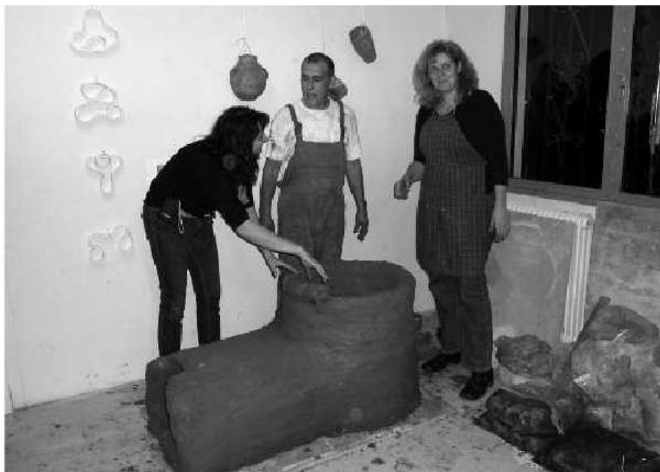
Épül az égetőkemence

A mindössze néhány napos igen jó hangulatú programról hazafelé jövet újabb feledhetetlen élményekkel gazdagodtunk. Az alkonyatkor leereszkedő gép ablakaiból kitekintve az egyik oldalon a naplemente, a másikon a holdfelkelte színpompás látványa tárult eléink. Mindezt még emlékezetesebbé tette az összekovácsolódott csoport tagjai közt kialakult kitűnő csapatszellem, az egymás iránti tisztelet és szeretet. Én magam sokat utaztam, de ilyen mesés leszállásban még soha nem volt részem.