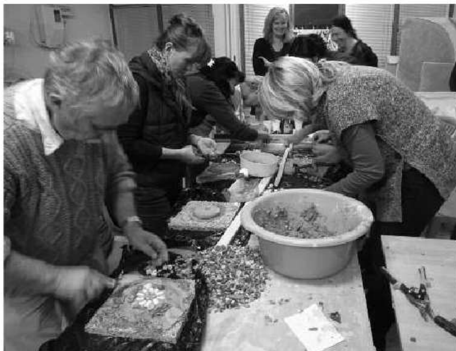
Az új technika gyakorlása

A következő délelőtti programunkat az igen modern Pella múzeum látogatásával kezdtük. Pella volt a macedón birodalom központja, itt töltötte ifjú éveit Nagy Sándor. A várost földrengés pusztította el, majd a feledés homá-