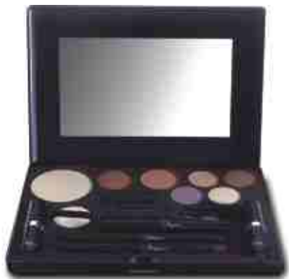
Dusty Rose 104