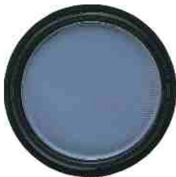
Blue Bayou 136