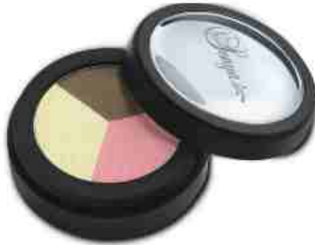
Springtime Trio 203