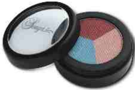
Sedona Trio 204