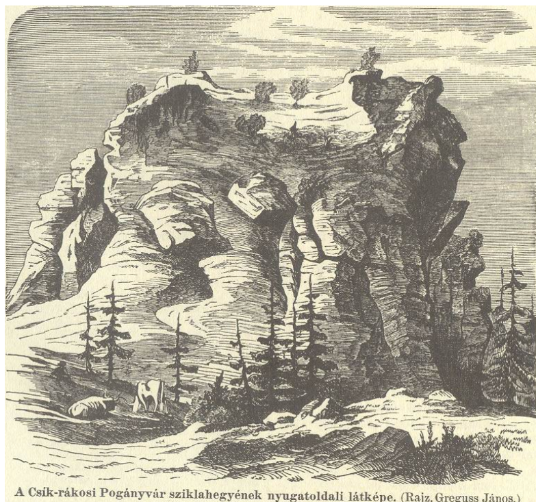
A Csík-rákosi Pogányvár sziklahegyének nyugatoldali látképe. (Rajz. Greguss János.)

Rákos határában, a falutól körülbelül hét-nyolc kilométer távolságban, a Hargita egyik dombján találjuk „Pogányvár” romjait. A Pogányvár valamikor a rabonbánoknak volt egyik tartózkodási helye. A Csíki Székely Krónika szerint a honfoglaláskor a székelyek „fője” „Z.....” volt, akinek fiai voltak: Upulet, Upuor és Vogron, akinek feleségét Drusillának hívták.