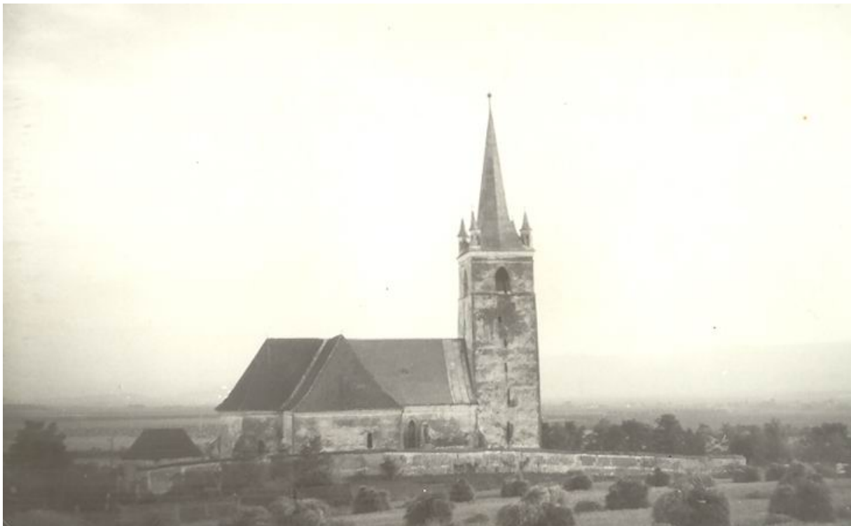
A csikrákosi vártemplom