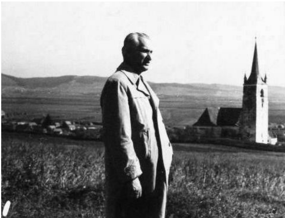
A szerző Csíkrákoson, háttérben a vártemplom

Temető itt minden halom, hősök temetője. Csodás történeteknek és legendáknak színhelye itt minden talpalatnyi föld. A váromladékok rég elmúlt idők sírkövei, melyekről lemosták már a felírást a felettük elviharzott századok, ezer esztendő emlékek csodás maradványai, melyeket annyi időn keresztül sem tudott megsemmisíteni az enyészet hatalma.