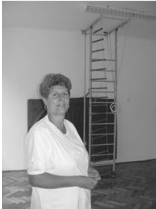
A Platán Úti Óvoda vezető óvónője büszkén mutatja az elkészült tornaszobát

Óvodában 240 ezer forintot költöttek a mosdó felújítására. A Menház Úti Óvodában 580 ezer forintért tetőfelújításra került sor, a Dobó Úti Óvodában pedig a kazánok felújítása vált szükségessé 2 millió forint értékben. Mátrafüreden a Hanák Kolos Általános Iskola, Kollégium és Óvoda társadalmi munka és a Polgármesteri Hivatal 50 ezer forintos segítségével a mosdókat újította fel.