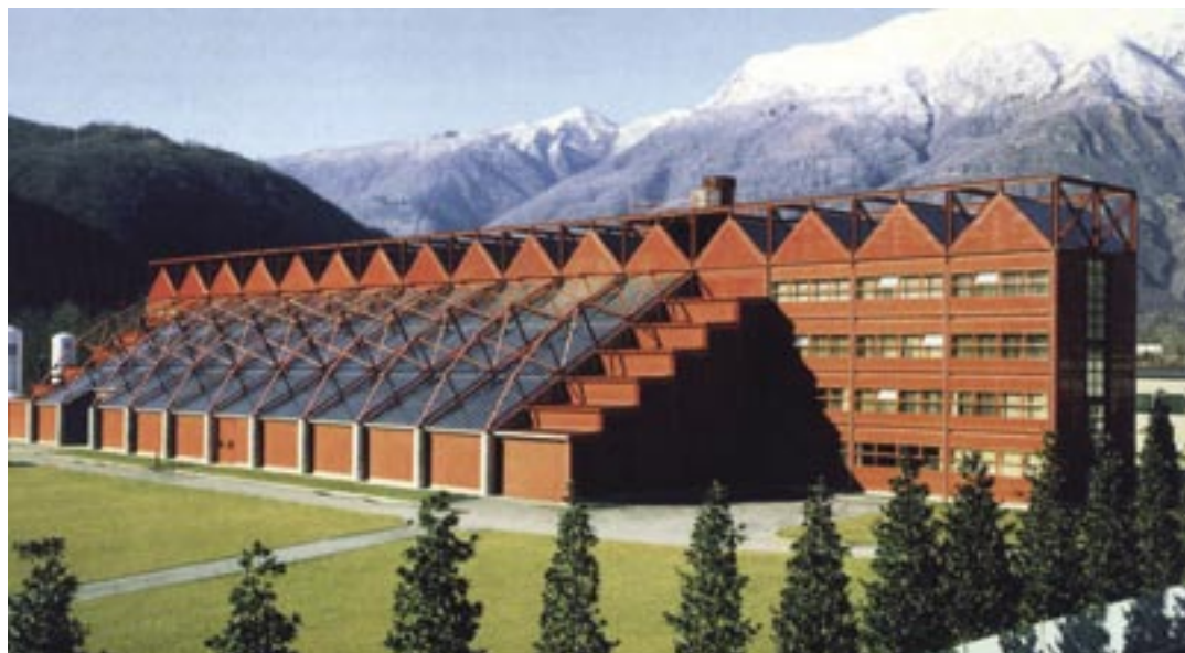
Hasonló konvertáló erőmű fog a Karácsondi úton is felépülni

Azért, mert Gyöngyös környezetvédelmi szempontból a legintelligensebb önkormányzatnak bizonyult az egész Kárpát-medencében. Pedig higgyék el, hogy én aztán nem vagyok ott senkinek a rokona... Mi pedig beruházási elképzeléseinkkel egyszerűen az utcáról mentünk be a polgármesteri hivatalba. Történt, hogy amikor a környezetvédelmi minisztérium 6 évvel ezelőtt meghirdette a hulladéktárolás új irányelveit, ak-