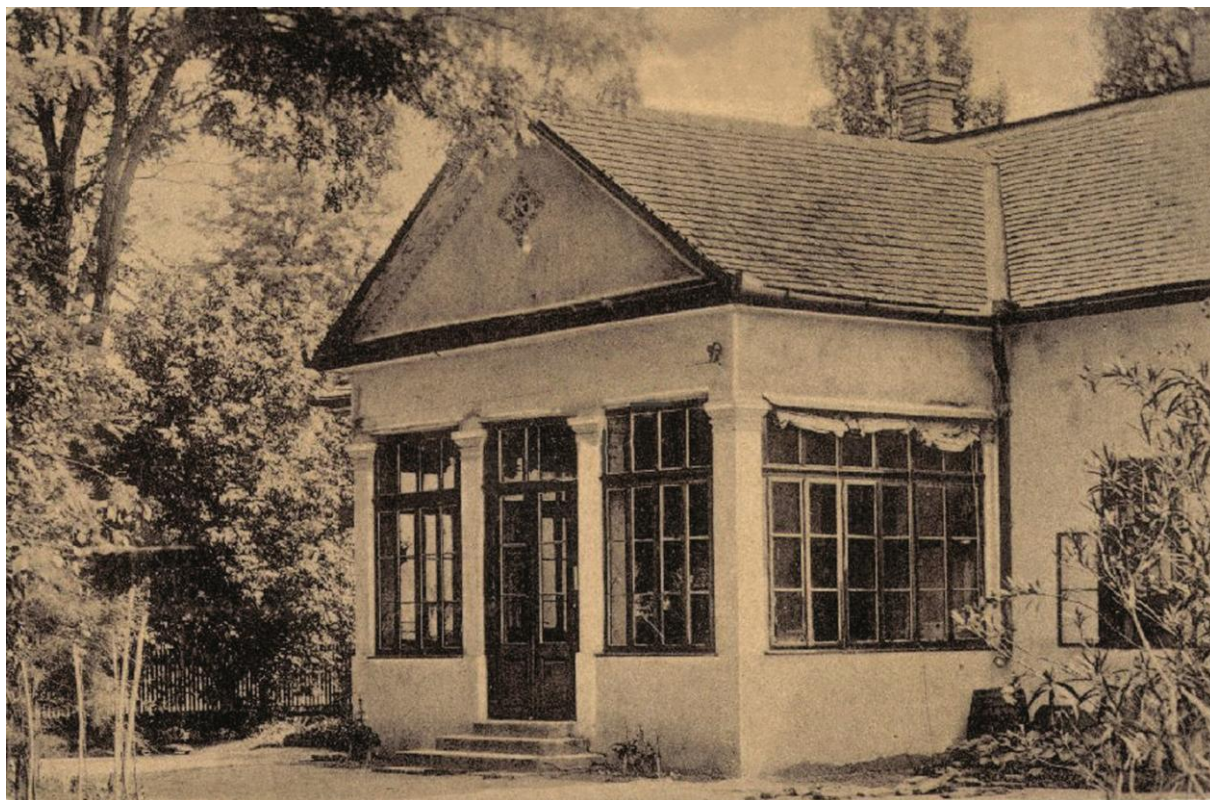
4. ábra A Láczy család kúriája Alberti-Irsán 33