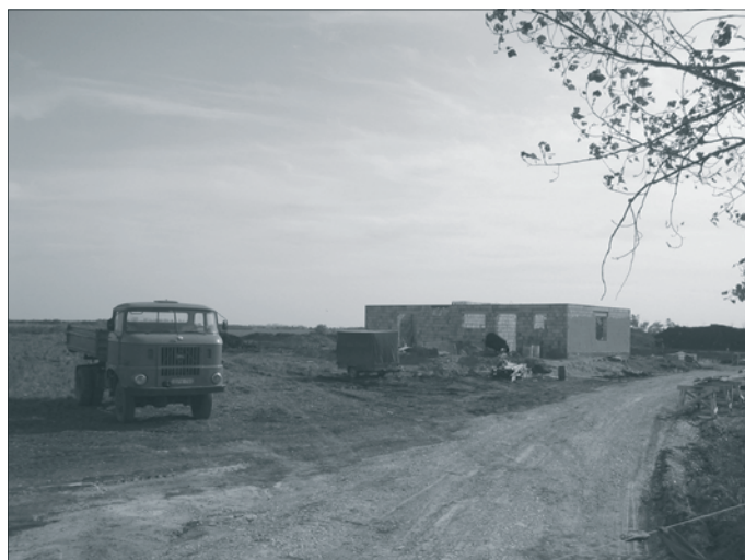
A tisztítómű kezelőépülete munka közben.