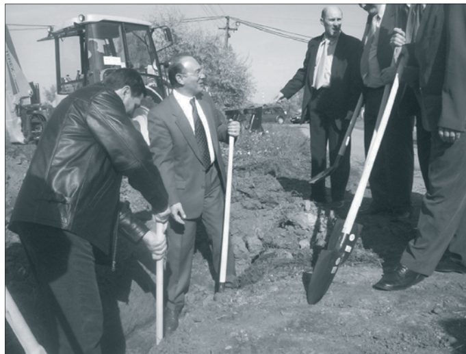
Az első kapavágás 2004. október 20.

A szennyvízhálózat építése 2004 és 2006 októbere között