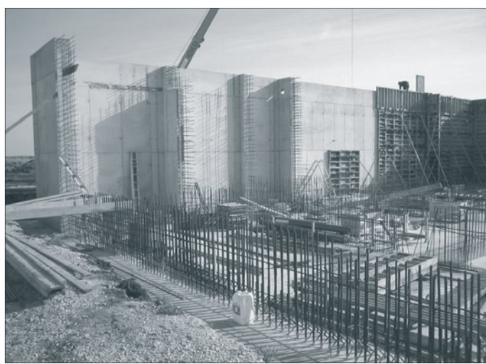
A szennyvízfogadó komplexum betonozás közben. Az elkészült rendszer 2006 októberétől 2000 köbméter szennyvíz tisztítására képes.