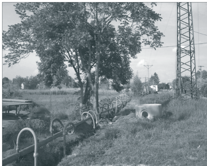
Talajvízszint-süllyesztésre volt szükség a csapadékos időjárás miatt