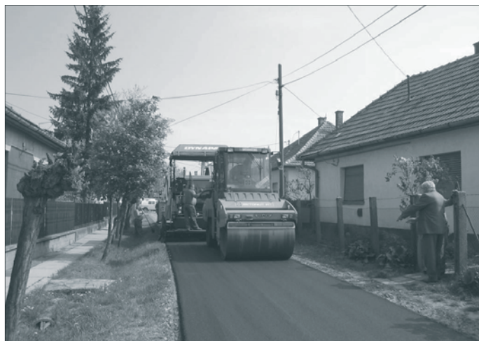
Az utcák helyreállítása során 120.000 négyzetméter útfelület felújítása készült el. A beruházás nettó értéke 2,5 milliárd forint volt.