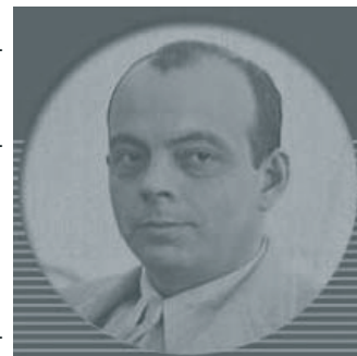
Antoine de Saint-Exupéry 1900–1944.