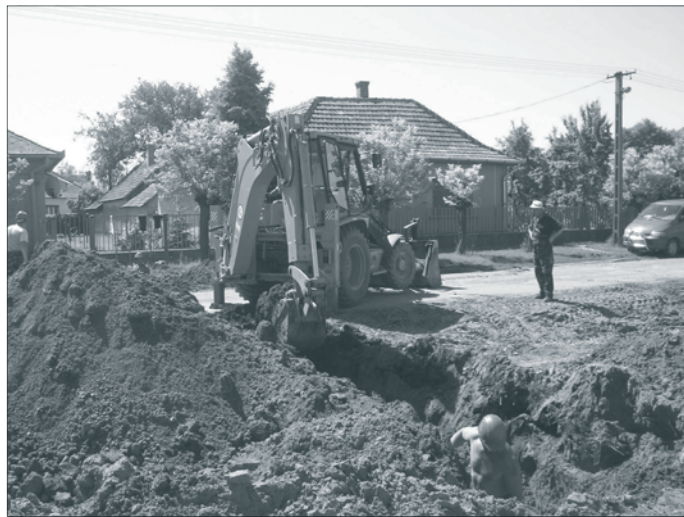
Utcakép csatornafektetés közben. Összesen 56.166 méter gerincvezeték épült és 2006 év végéig 2227 ingatlan csatlakozott a szennyvízhálózatra.