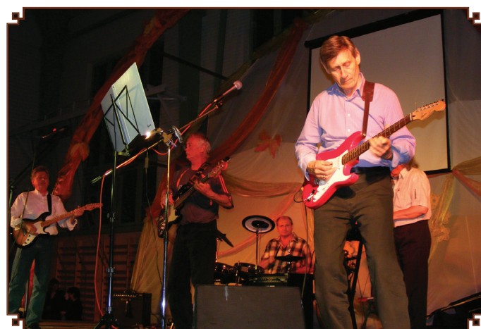
Szép volt fiúk! Harsogott a rajongók tábora a IV. G. osztály újjáalakult zenekarának.