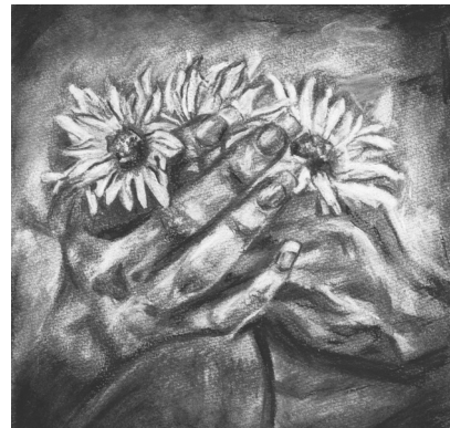
Faragó Nikolett rajza

Rohamosan változó kor, változó életmód, változó értékrend. Manapság már a fiatalságnak eszébe sincs nem tegezni formába öltetni mondanóját a szülei felé, egyszerűen a kedveskedő, vagy kicsinyítő jelzős alakok, megszólítások adhatják a szülők tudtára, hogy gyermekeik szeretik őket. Ugyanilyen kifejezőmód az óvodában az Anyák napi ünnepség. Hisz nincs is szebb, minthogy egy csöppnyi csillogó szemekkel énekel, vagy próbál egy vídám verset elmondani, miközben arcán a gyermeki ártatlanság tiszta mosolya parázlik. Ez nemcsak az édesanyáknak, de a gyermekeknek is örök érték maradhat a manapság jellemző labilis értékrendet figyelembe véve.