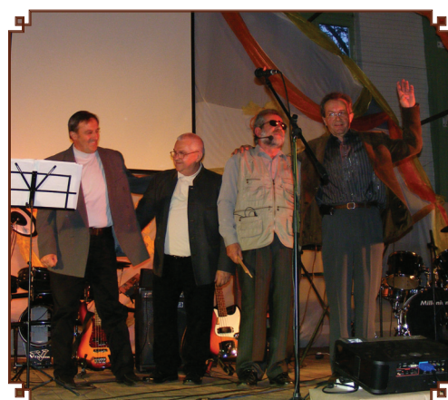
Az Alma Máter együttes zenéje zárta az estét a különleges Makó Pál Napokon.