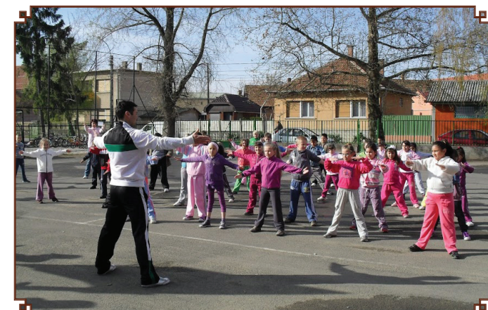
Tornával kezdődött az Egészségnap az általános iskolában (cikk a 9. oldalon.)