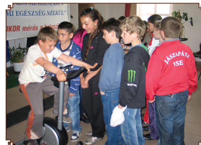
Április 13. egészséges péntek volt a gyerekeknek, nem babonás.