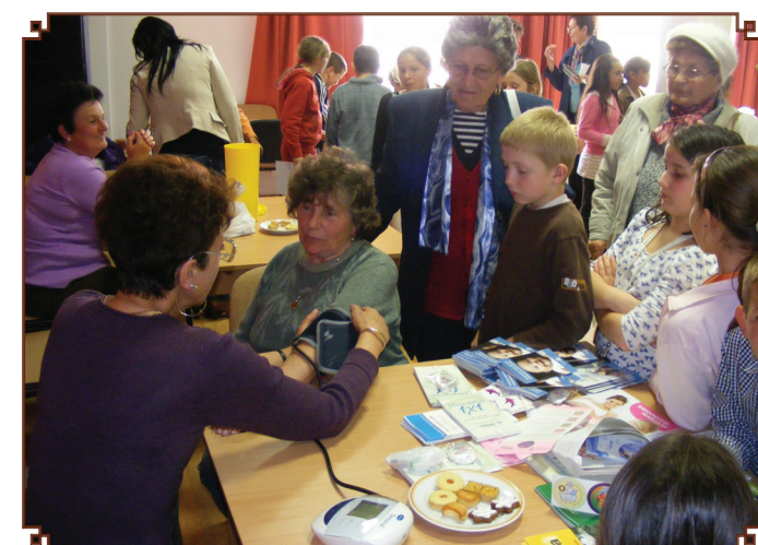
Vérnyomás mérés gyerekeknek és időseknek.