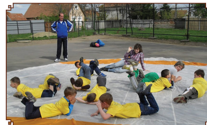
Iskolanyitogató - óvodások a 48-as iskolában