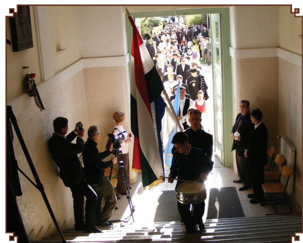
Zászló avató. A százéves évfordulóra megváltozott a gimnázium. A felújított épület elé a kertben országzászlót helyeztek el, új neve van, márciustól új igazgató kezdte meg a munkát és hamarosan új fenntartója is lehet.