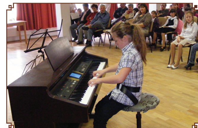
A Zenés könyvtári esték sorozat záró koncertje március 31-én a Művészetek házában volt, ahol a Rácz Aladár Zeneiskola legfiatalabb diákjai mutatták meg tudásukat.