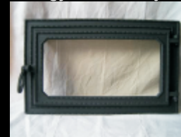
Egyszárnyas II.lb Egyenes sütőajtó

Külső méret: 300x500 Beépítési méret: 220x420