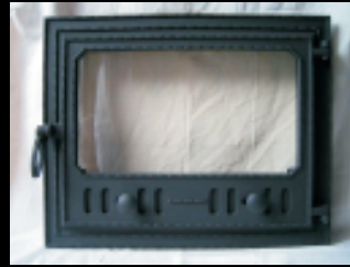
Egyszárnyas II.lb Tüzelőajtó

Kiss Kandallóajtók, ha a legjobbat akarja magának!