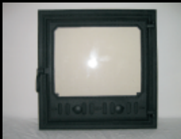
Egyszárnyas III. ajtó

Külső méret: 500x500 Beépítési méret: 420x420