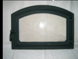
Egyszárnyas II.lb Ives sütőajtó

Külső méret: 355x500 Beépítési méret: 270x420