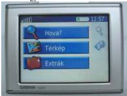
A GXT egy nüvi-n: