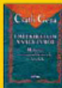
Csillagok és föld 2200 Ft helyett 1100 Ft