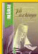
Jób... és a kőnyom 3408 Ft helyett 2990 Ft