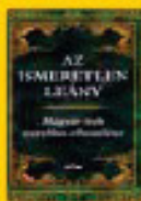
Az ismeretlen lány 2208 Ft helyett 2090 Ft

Minden kedves vásárlót szeretettel várunk! Címünk: Géniusz Könyvruház, 1065 Bp., Bajcsy Zs. 5. Tel.: 411-1123, 411-1124