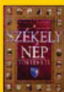
A Székely nép története 1048 Ft helyett 990 Ft