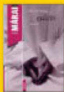
Erőszak 2090 Ft helyett 1998 Ft