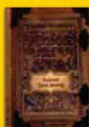
Magyar mesék könyve 2290 Ft helyett 1998 Ft