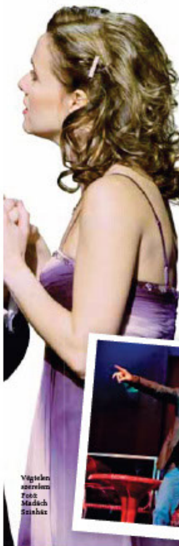
Végeken szerelem

– Hát pontosan ez az, hogy ott már nem volt fejlődési lehetőség musical téren, ezért el kellett döntenem, hogy maradok-e, és huszonegy évesen a nyugodt, biztos életet választom, vagy váltok, és nyitok egy olyan ország felé, ahol színesebb a zenés színházi kínálat és újfajta kihívások elé nézhetek. Németország és Magyarország között hezitáltam, és