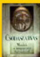
Csodaszarvas 5580 Ft helyett 4790 Ft