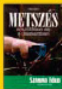
Metszés az 18. században 405 Ft helyett 358 Ft