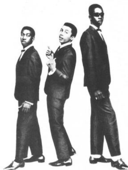
The Wailing Wailers (1964) Bunny, Bob és Peter