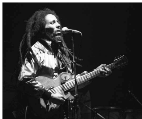
Zürich-i koncerten 1980. május 30.

Bob Marley 1976-ban, egy lövöldözés után, mely kis híján az életébe került, elhagyta hazáját, s csak két évvel később tért vissza. Ugyanabban az évben járt életében először Afrikában, Kenyában, majd Etiópiában. 1980-ban, a zimbabwei kormány meghívására tért vissza a forró kontinensre, koncertezni. Ekkoriban Európában is óriási sikereket arattak, s amerikai turnéra készültek, amikor kiderült, Marleynek rákja van. A betegség nyolc hónappal később, 1981. május 11-én végzett a 36 éves zenésszel, aki nem csupán muzsikájával vált a feketék profétájává, hanem a rasztafarizmus hirdetésével is. Hamvait özvegye akarata szerint 60. születésnapján, február 6-án helyezték örök nyugalomra Etiópiában, mely a raszták számára az ígéret földje, ahol először lépett trónra fekete császár, Hailé Szelasszié, azaz Rasz Tafari Makonnen személyében. A rendezvények csúcspontjaként aznap óriási Marley-émlékkoncertet rendeztek Addisz-Abebában Peter Gabriel, Youssou N'Dour, Gilberto Gil, Shaggy, Lauryn Hill, Angélique Kidjo s a Third World közreműködésével, mely az Africa Unite nevet viselte. Később megjelent DVD-n Amerikában.