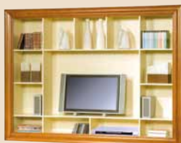
M - P2 W: 603, S: 1200, G: 218