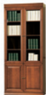
SE-2 regał W 2355 S 1010 G 450