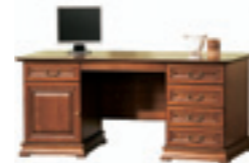
SE-biurko W 775 S 1805 G 850