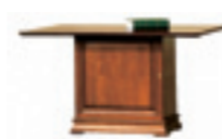
SE-1 pomocnik W 745 S 1315 G 850