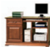
SE-3 pomocnik W 775 S 1245 G 560