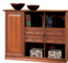
SE-3 komoda W 1212 S 1602 G 456