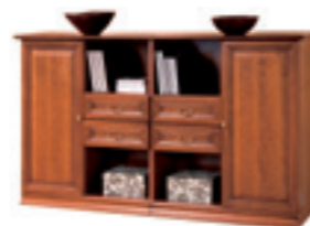
SE-4 komoda W 1212 S 2114 G 456