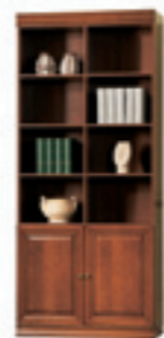
SE-3 regał W 2355 S 1010 G 450