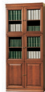
SE-1 regał W 2355 S 1010 G 450