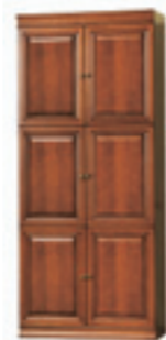
SE-4 regał W 2355 S 1010 G 450