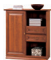
SE-2 komoda W 1212 S 1102 G 456