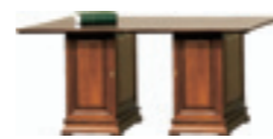
SE-2 pomocnik W 745 S 2200 G 850