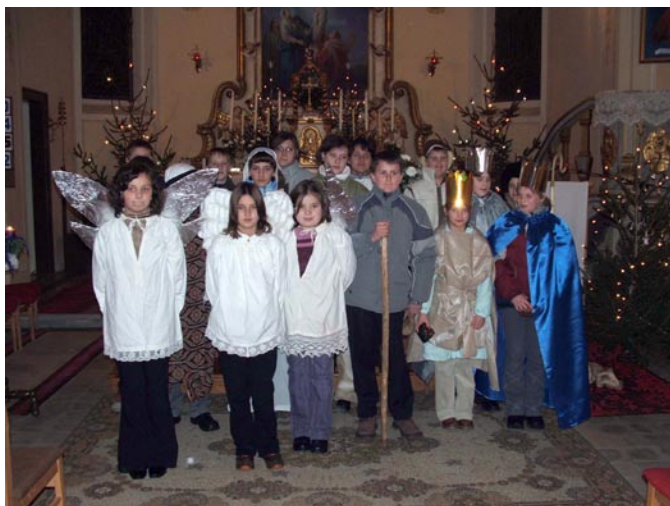
Karácsonyi műsor az Éjféli mise előtt Felsőszölnökön