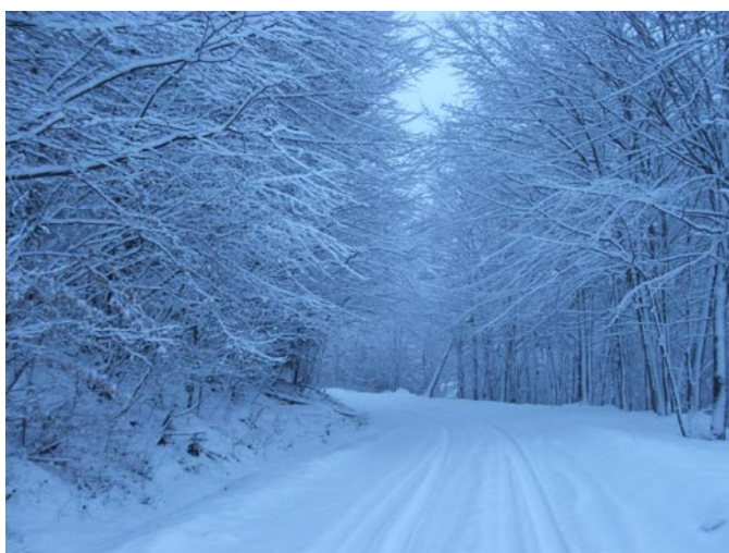
Tél a tavaszban március 12-én Kakasdombi út.