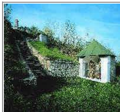
A magyarpolányi kálvária

Műemlék plébániatemplomát Szent László király tiszteletére építették.