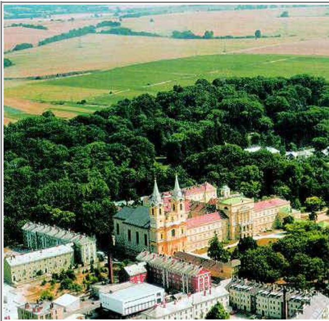
Zirc - légifelvétel

A Magas-Bakony szívében a Cuha-patak mentén fekszik a Bakony „fővárosa” : Zirc. Alapítása III. Béla nevéhez fűződik. A király francia ciszterciákat hívott, s a betelepült rend tagjai hozták létre bakonyi apátságukat. A franciáktól a XIII. század elején a porosz cisztercita szerzetesek vették át az irányítást. A múlt század végétől folyamatosan fejlődő nagyközség – a régió gazdasági és kulturális központja – 1984-ben városi rangot kapott.