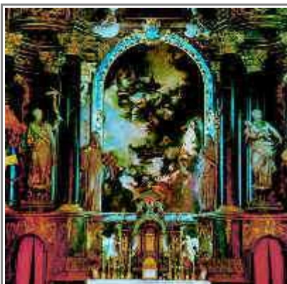
A zirci cisztercita apátság templomának főoltára

A szintén Reguly nevét viselő néprajzi múzeum egy épületben található a „foglalkoztató házzal”, ahol a gyerekek és felnőttek betekintést nyerhetnek a fazekas-, szövő-, kosárfonó- és egyéb népi mesterségek műhelytitkaiba.