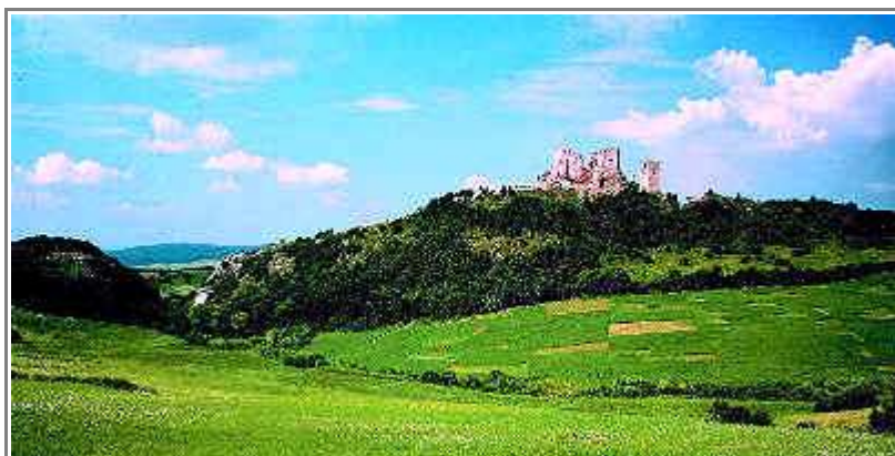
A cseszneki vár

Farkasgyepű szubalpin klímája miatt az itt épült tüdőszanatóriumban keresnek gyógyulást a betegek. A falu előtt található a természetvédelmi területté nyilvánított kísérleti erdő, melyben a bükk természetes módon újul meg, nem szorul telepítésre.