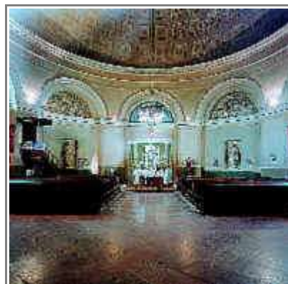
Ganna - felső templom

Csesznek a Magas- Bakony északi peremén terül el. A mészkővonulat éles gerincén áll a gótikus cseszneki vár maradványa. Vélhetően IV. Béla idejében épült, s urai között olyan neveket találunk, mint Szapolyai