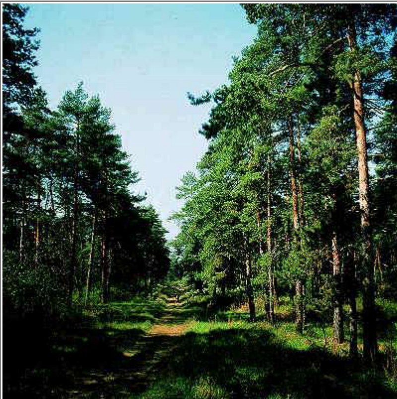
A fenyőfői ősfenyves

A Bakony hazánk legnagyobb kiterjedésű és legváltozatosabb morfológiájú hegysége, amely elnyúló dolomit- platóival, lomha hegyhátaival, meredek vulkáni kúpjaival, hol szelíd, hol sziklás falú patak völgyeivel egyaránt barangolásra csábít. A hegység fő tömegét ősmaradványszegény triász kori mészkő és dolomit alkotja, de az út során több helyen lehet Szent László pénzére lelni, és híresek a Kapolcs környéki vulkáni bazaltos kőzetek olivinbombái is.