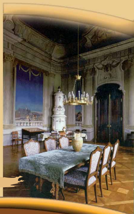
Veszprém, Érseki Palota

Az 1730-as években épült Ferences templom kriptájában helyezték örök nyugalomra a magyar felvilágosodás költőjét, Ányos Pált.