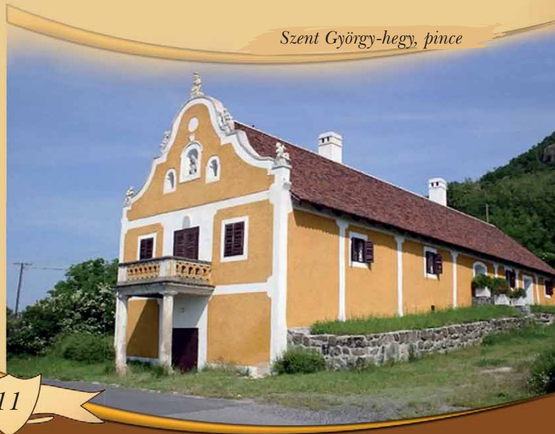
Szent György-hegy, pince