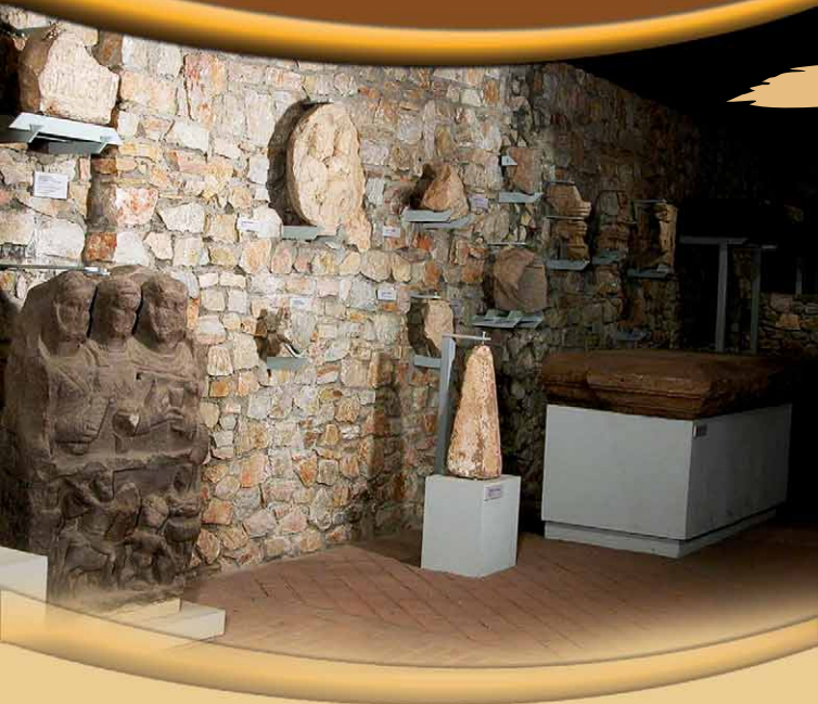
Balácsa, római kori villagazdaság