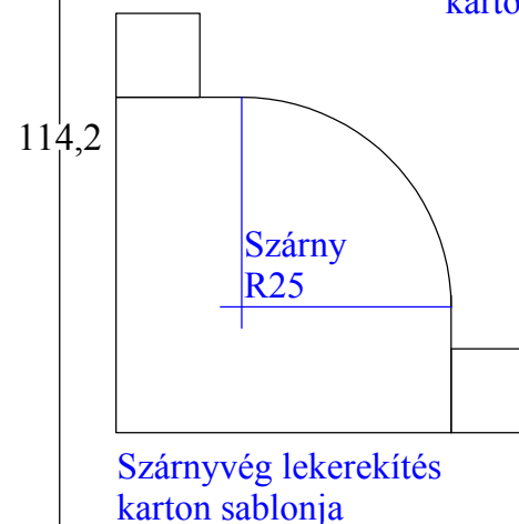
Szárnyvég lekerekítés karton sablonja