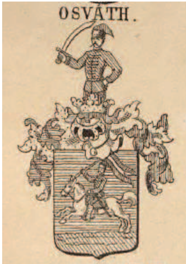
Az O'SVÁTH család címere.

SIEBMACHER, Johann: Grosses und allgemeines Wappenbuch in einer neuen, vollständig geordneten und reich vermehrten Auflage mit heraldischen und historisch-genealogischen Erläuterungen. 468.p. + 343.tábla. [Nagy és általános címerkönyv egy új, teljesen rendezett, heraldikus és történeti-genealógiai magyarázattal gyarapított kiadásban.] IV.köt. (Der Adel von Ungarn. [Magyarország nemessége.]) Nürnberg, 1893 15 , Verlag von Bauer und Raspe. 468 p.