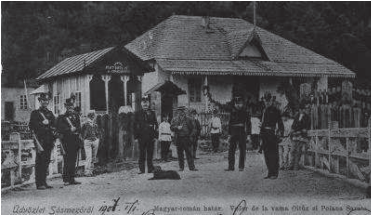
Az Ojtozi-szoros határátkelőhelyénél elfogott határsértők 1886-ban.