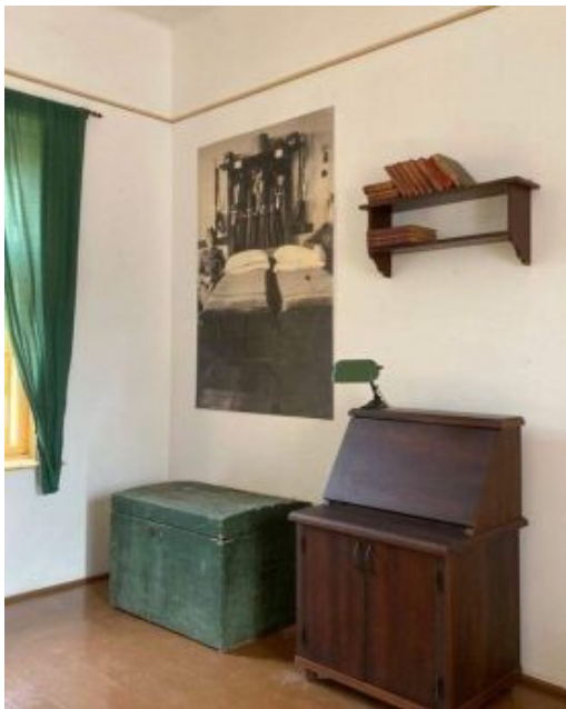
Az ÓNTE csendőr kiállítás hálózobai oldalának egy részlete.

Amíg a Covid járvány, az ukrán háború és az EU anyagi zsarolása a csendőrlaktanya ÓNTE-n való felépítését késleltette, annak a költsége az öt évvel ezelőtt várt 73 millióról mára már 240 millióra növekedett. Nagyon reménykedünk viszont, hogy az EU szorításából kikerülve államunk végre biztosítja majd ezen jelentős építkezés fedezetét. Barátaink támogatását viszont továbbra is kérjük az épület